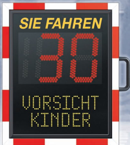
Abmessung: 63,4 x 84,4 x 18,2 cm (B x H x T)